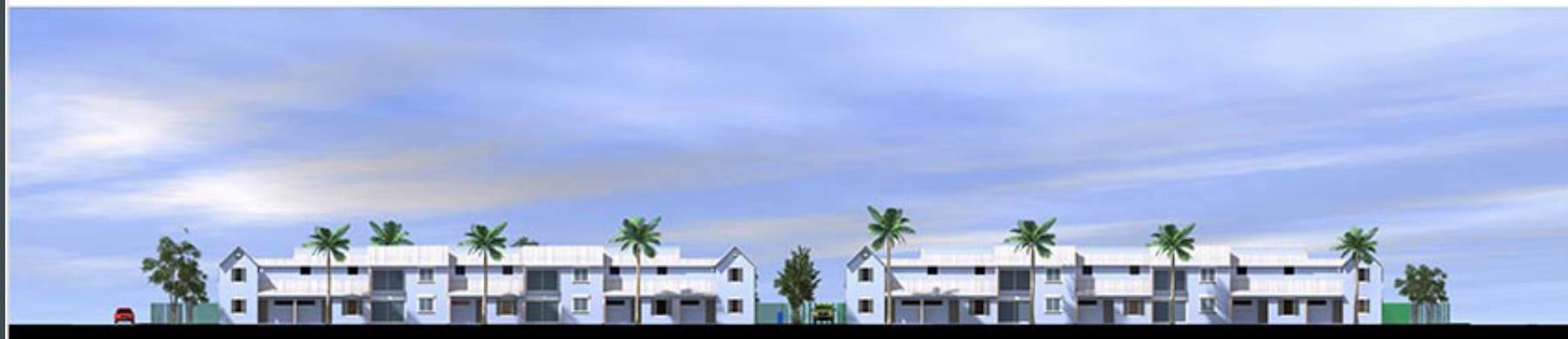
Façades sur espace intérieur