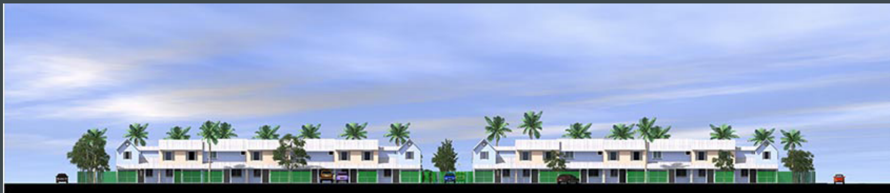
Façades sur rue